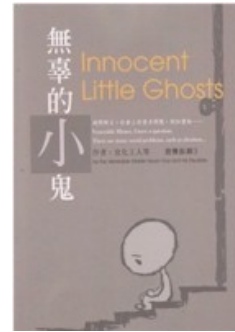
Những Thai Nhi Vô Tội (Việt/Anh)