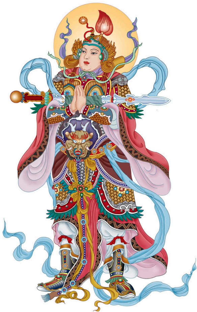
Nam Mô Hộ Pháp Vi Đà Tôn Thiên Bồ Tát